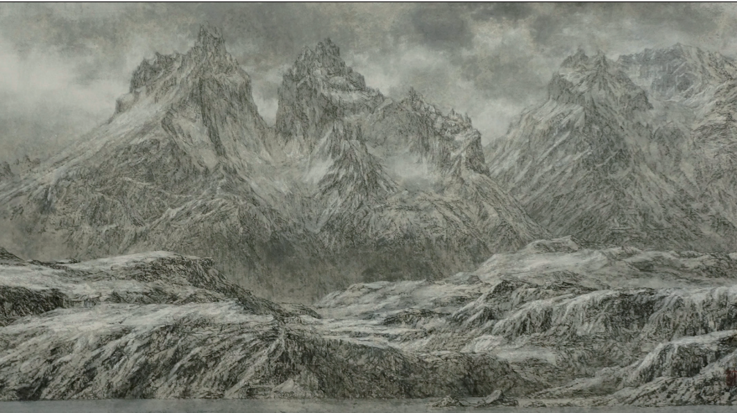
金子洋平 / Cuernos del Paine M10