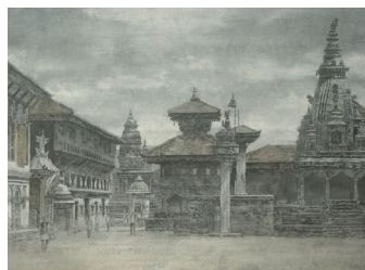
Bhaktapur, Durbar Square M10