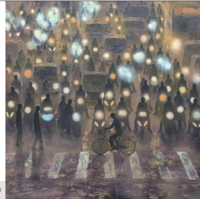
宮治 綱 / ラッシュ S40号