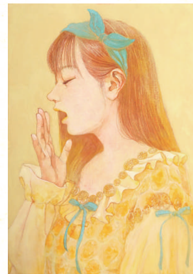
LINK(honey lemonade) SM