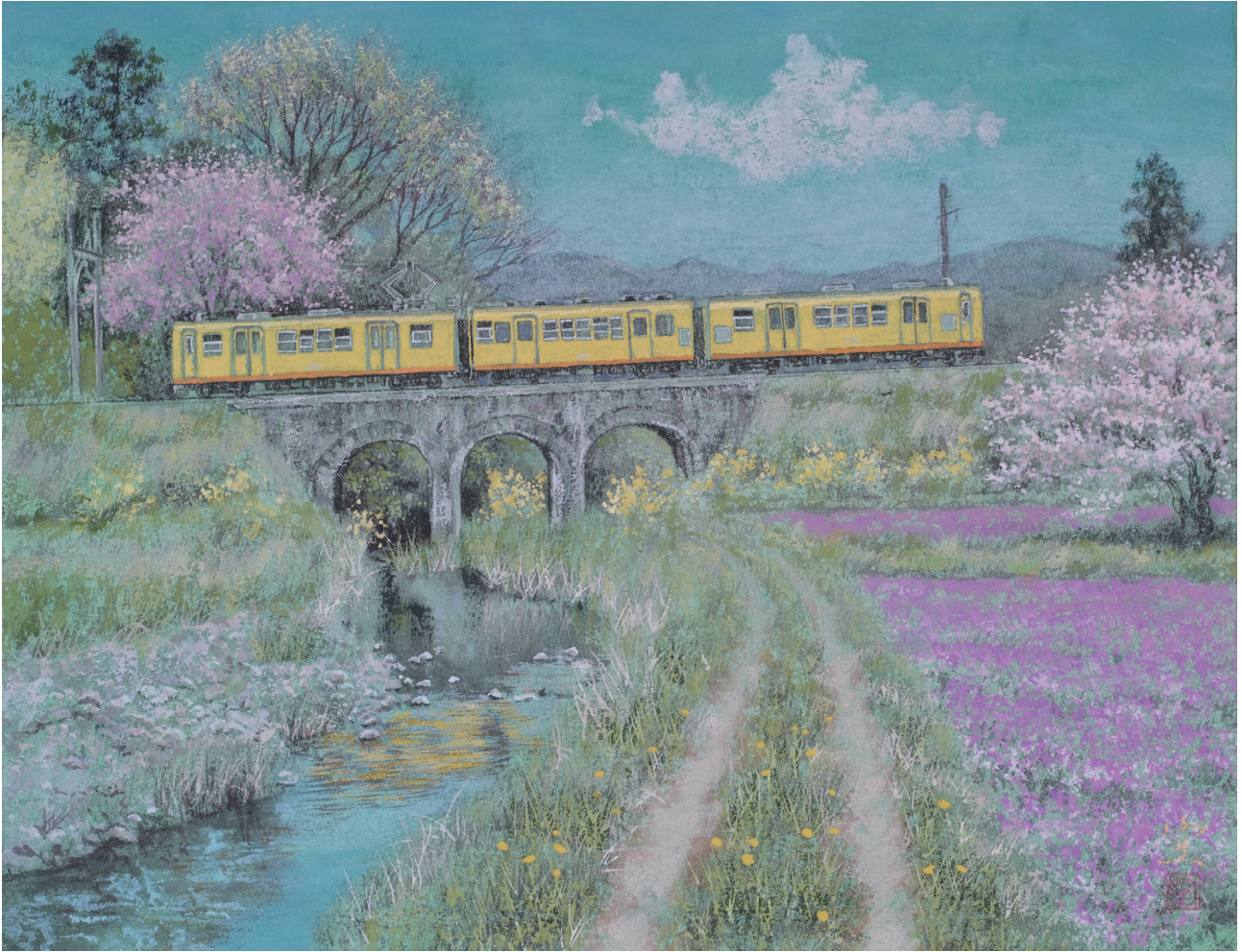
「春彩電車」F6 三重県いなべ市 三岐鉄道北勢線