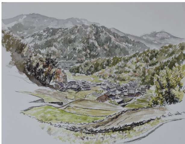
松阪市深野 棚田俯瞰