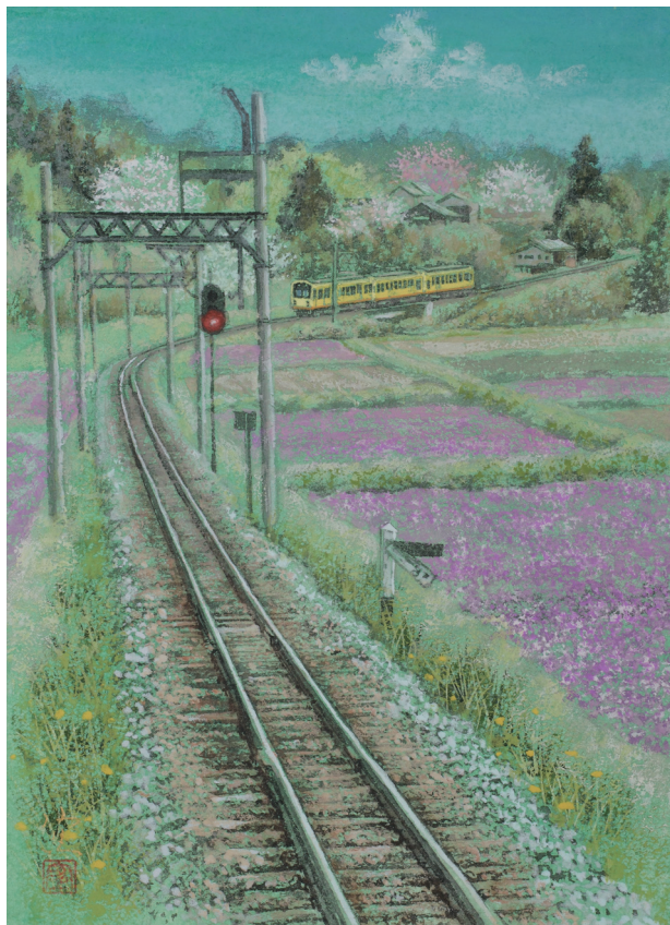
「春彩小径」 いなべ市 三岐鉄道北勢線