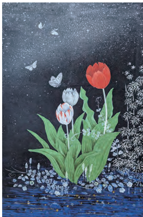
「星空のチューリップ」(400mm×270mm)