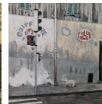
「マルセイユの路地裏」 (100mm×100mm)