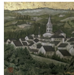
「ノートル・ダム・オルシヴァル」 (120mm×120mm)